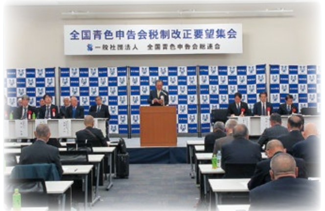
税制改正要望集会