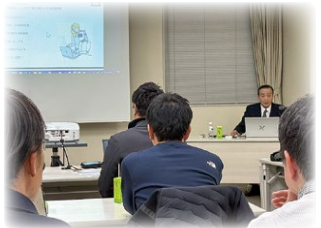
ChatGPTで変わる！ビジネスの未来 (12月10日)

最後にありますが、今後も、福井青色申告会青年部のさらなる発展のため、尽力していきますので、関係者の皆様方のご支援、ご協力をよろしくお願い申し上げます。