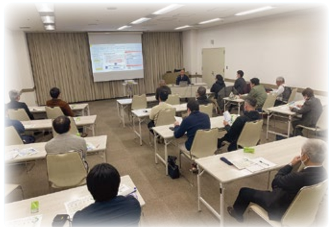
福井税務署長講話（11月20日）

の交流、情報交換を行うなどとても賑やかな例会となりました。9月10月12月には講師をお招きして広告、SNS、NISA等をテーマの勉強会を開催することができました。11月には「税を考える週間」とし神田福井税務署長