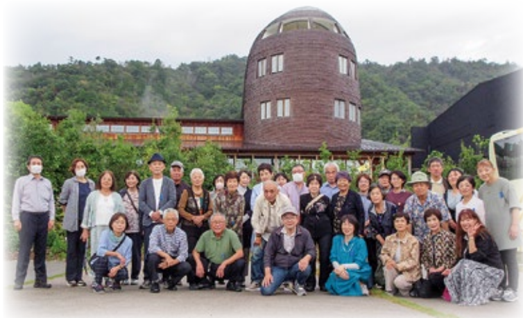
ラコリーナ近江八幡

身を委ねて、秋の曇り空の下、一期一会の旅友と笑い合う楽しいひと時を過ごしました。最後は、バームクーヘンで有名なクラブハリエのお店ラコリーナです。自然の中にお店が点在していて、何度訪れても古き新しき発見のある不思議な空間です。琵琶湖疎水遊覧の舟で一緒に旅友とお茶をしました。焼きたてのカステラと紅茶、楽しいおしゃべりも貴重な時間でした。今年の青色バス旅行もとても楽しかったです。素敵な休日のひと時をありがとうございました。